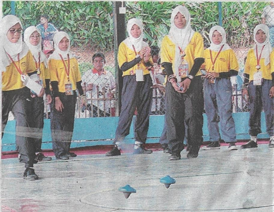
PEMAIN gasing wanita terdiri daripada pelajar Sekolah Menengah Teknik Sanggang membuat demonstrasi di Festival Gasing Malaysia 2007 di Dataran Temerloh, Pahang, baru-baru ini.