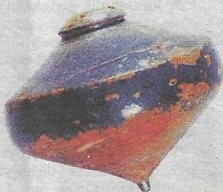
GASING LANG LAUT