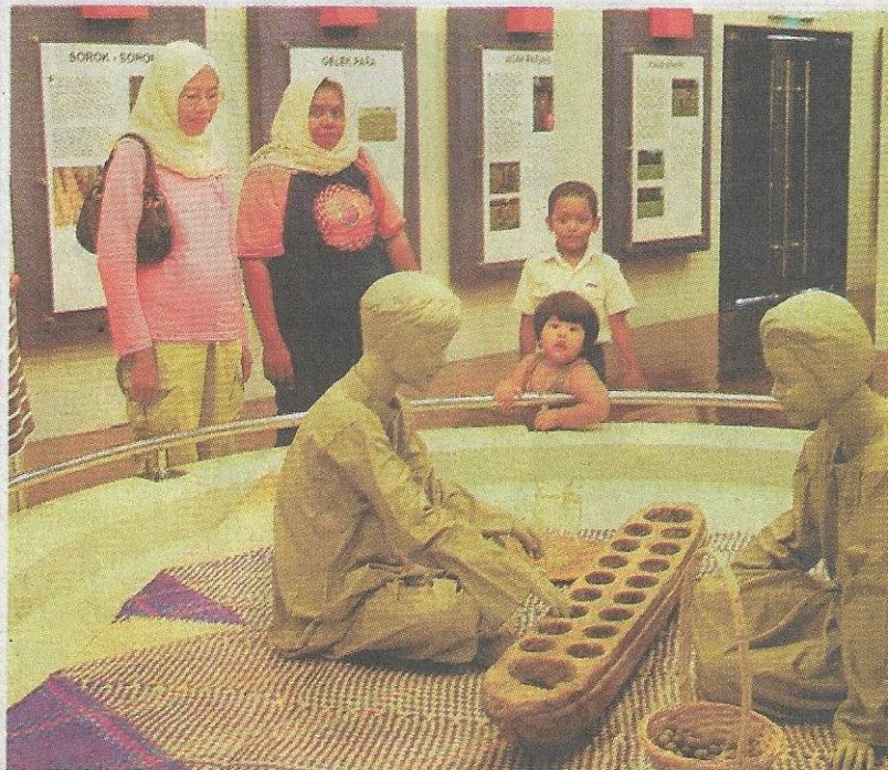
WARISAN: Pelbagai jenis permainan rakyat dipamerkan termasuk permainan congkak.