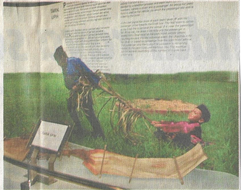
BELUM DILUPAKAN: Maklumat mengenai permainan tarik daun upeh turut dipamerkan.