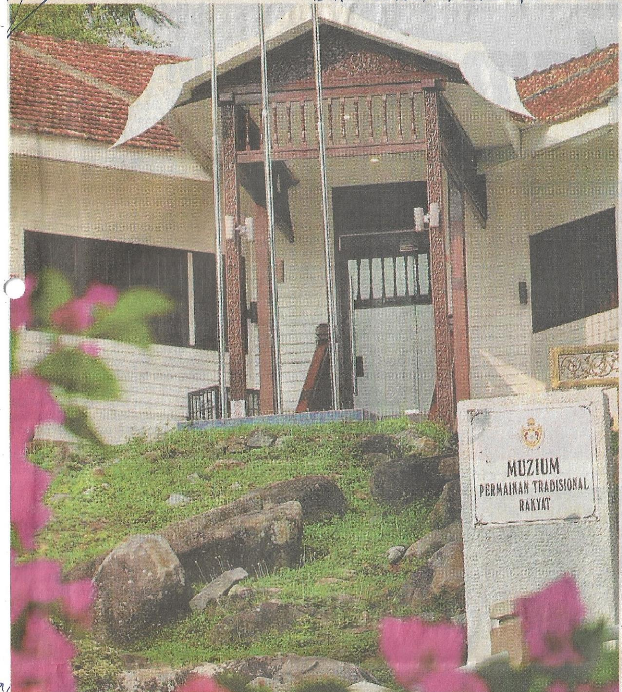
MENARIK: Rumah jurutera di puncak Bukit Malawati yang diubah suai menjadi Muzium Permainan Tradisional di Kuala Selangor.