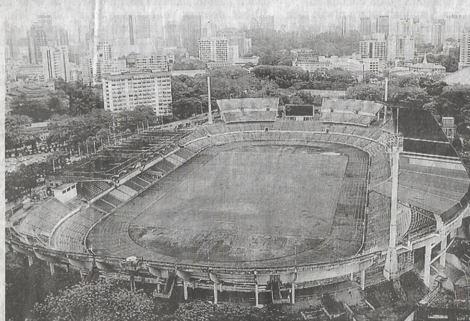
SIMPAN SEJARAH: Stadium Merdeka menyimpan sejarah sebagai tempat berkumpul penduduk ketika kemerdekaan negara yang pertama.

layu yang kemudian bekerjasama dengan bangsa lain untuk mengusir penjajah.