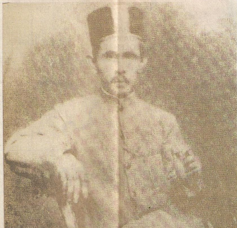
■ SULTAN Ahmad Al-Mu'azzam Shah Ibni Al-Mahrum Bendahara Wan Ali

Tindakan Rodger menimbulkan kemarahan pembesar Melayu terutama Datuk Bahaman. Beliau enggan tunduk kepada perintah British dan terus mengutip cukai di Semantan. Tindakan Datuk Bahaman itu menyebabkan British menghantar surat amaran kepada beliau tetapi tokoh pahlawan itu tetap tidak