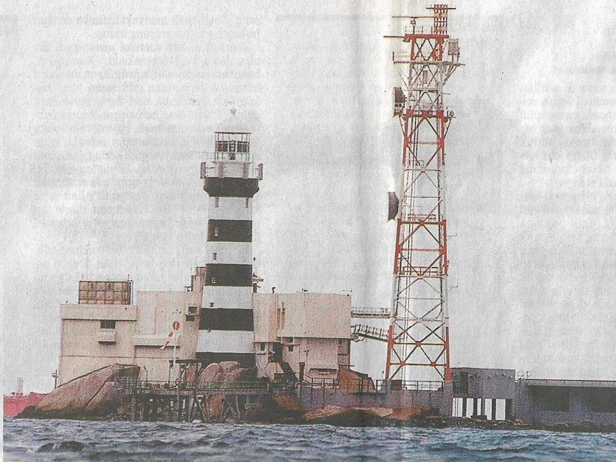
JADI REBUTAN: Pulau Batu Putih menjadi isu pertikaian Malaysia, Singapura.

Pada 1824, Kesultanan Johor menyerahkan Singapura kawasan sekitar 10 batu nautika kepada penjajah British menerusi Syarikat Hindia Ti-