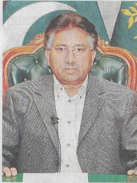
PRESIDEN Pervez Musharraf muncul di televisyen Pakistan, semalam.

Pakistan di bawah pemerintahan darurat, tetapi langkah ini sudah tentu akan mendapat tentangan dari Washington.