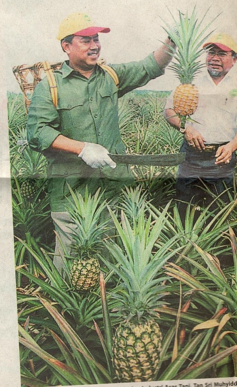
JANA PENDAPATAN: Menteri Pertanian dan Industri Asas Tani, Tan Sri Muhyiddin Yassin, bersama petani di Stesen Mardi Pontian.

Fokus besar yang diberikan kerajaan terhadap sektor pertanian me-