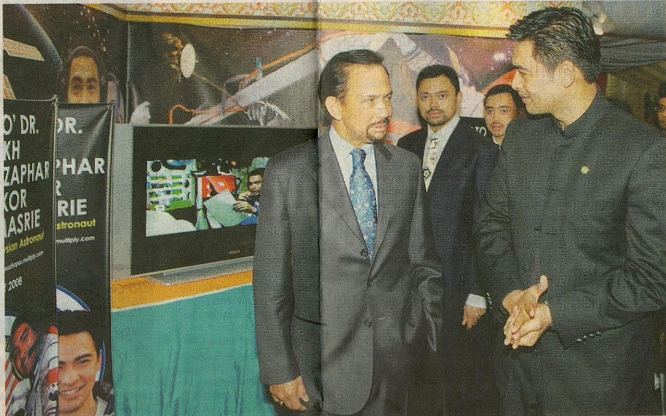
Dr Sheikh Muszaphar menceritakan pengalamannya di angkasa lepas kepada Sultan Hassanal Bolkiah di Brunei.

Antara 23 hingga 26 Julai lalu, saya dijemput oleh Jabatan Pejabat Mufti Brunei sempena 'Minggu Ilmu'. Di Brunei, pelbagai program berunsurkan sains dan keaga-