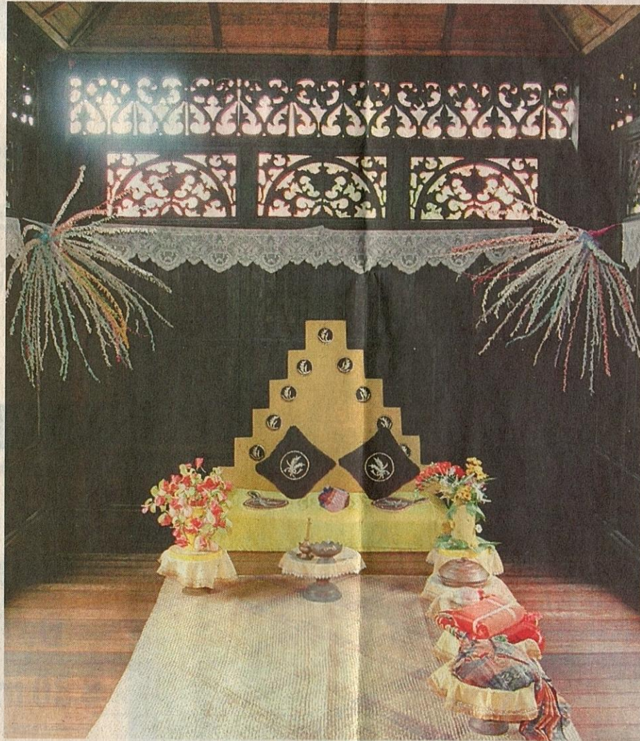
RUANG dalaman yang luas dan penuh ukiran merupakan identiti Rumah Penghulu Abu Seman.

Siapa sangka, hasil usaha BWM itu, rumah yang asalnya didirikan di Kampung Sungai Kechil, Mukim Bagan Samak, Bandar Baharu, Kedah lebih 90 tahun lalu kini berdiri megah di kelilingi bangunan pen-