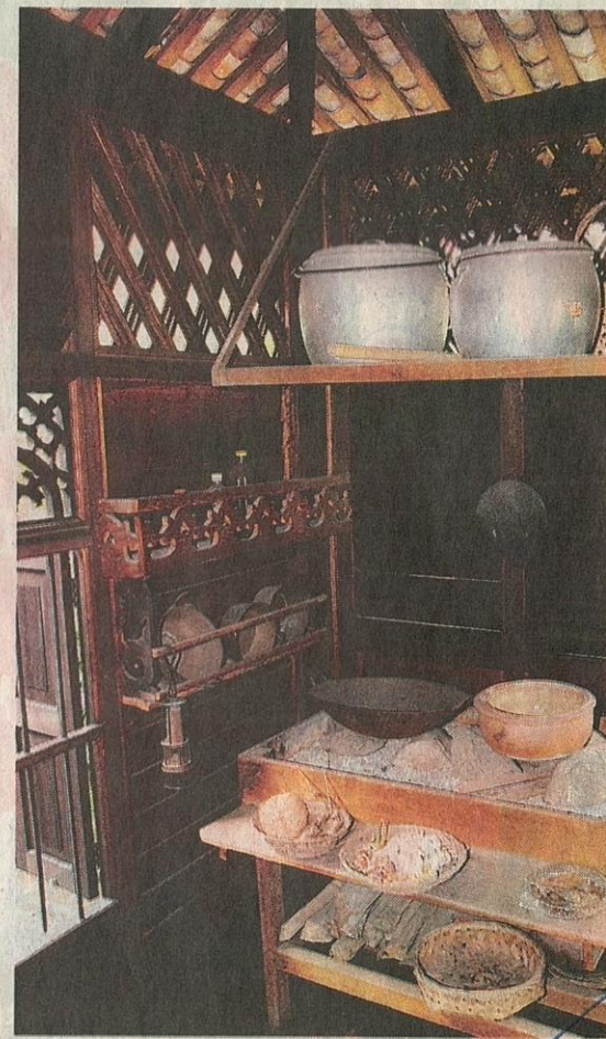
GAMBARAN sebenar ruang dapur rumah orang Melayu zaman dahulu dipapar di Rumah Penghulu Abu Seman.

Orang ramai yang berminat untuk mendapatkan maklumat dengan lebih lanjut tentang Rumah Penghulu Abu Seman boleh menghubungi 03-21449273 atau melayari laman web www.badanwarisan.org.my .