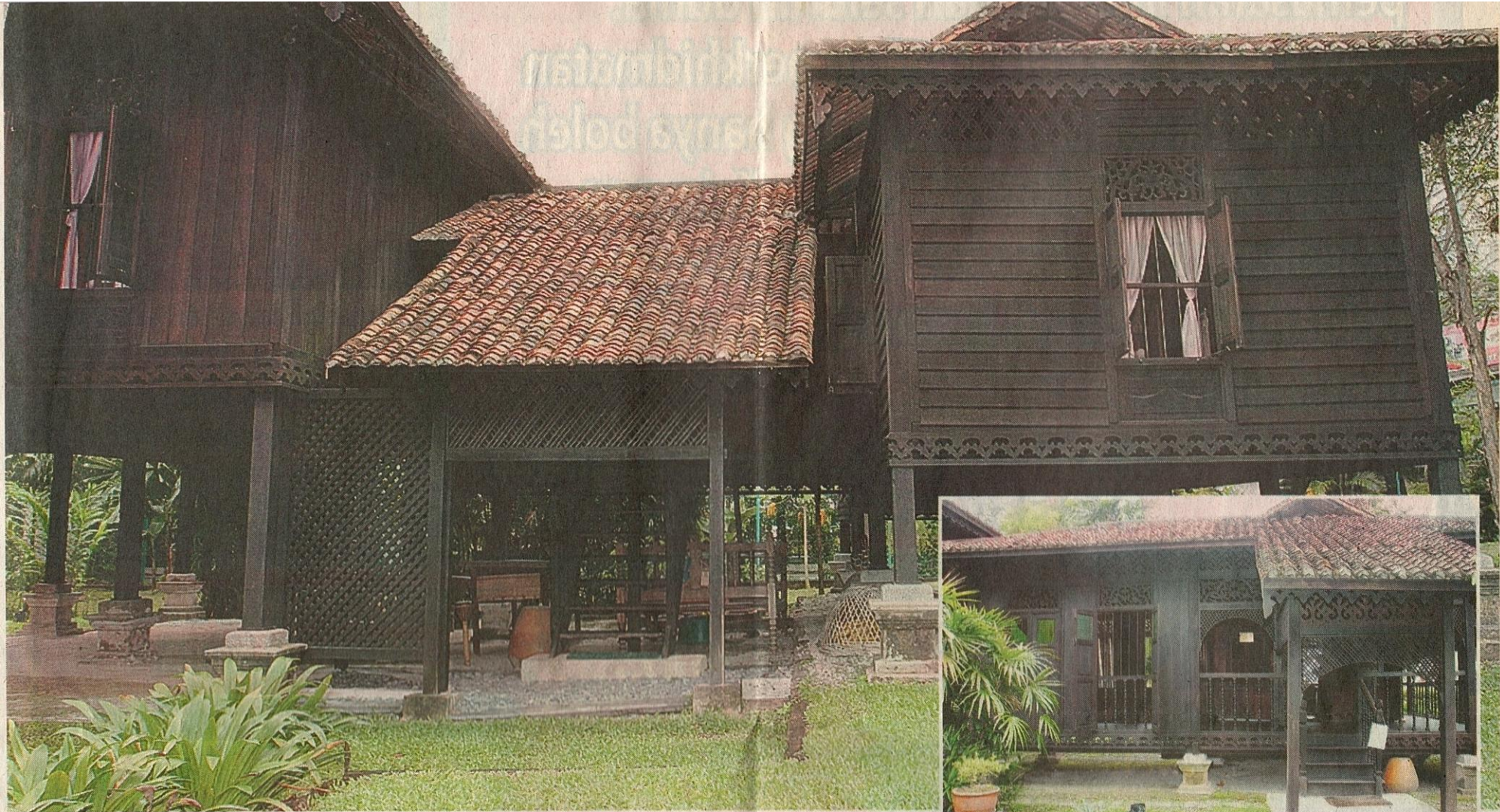
WARISAN... Keindahan seni bina Rumah Penghulu Abu Seman berjaya dikembalikan selepas dibaik pulih oleh Badan Warisan Malaysia.