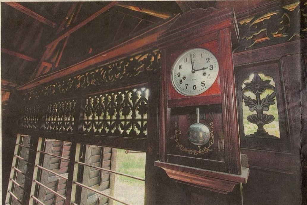
BARANGAN antik turut menjadi sebahagian hiasan dalaman.

"Tingkap dalam tingkap. Pasti jarang yang dapat melihat anak tingkap yang dibina bagi memudahkan meninjau keadaan di luar rumah pada waktu malam," cerita Abdul Hamid mengenai enam buah tingkap yang terdapat di ruang tersebut.