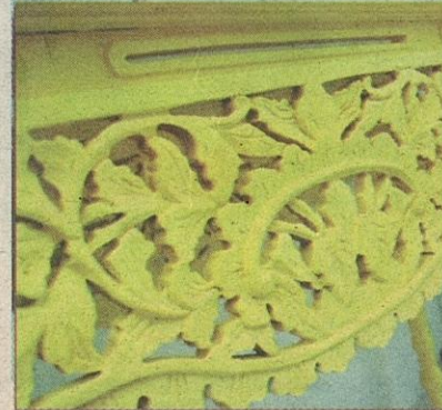
Meja konsol tampil berbeza dengan cat kuning pekat.