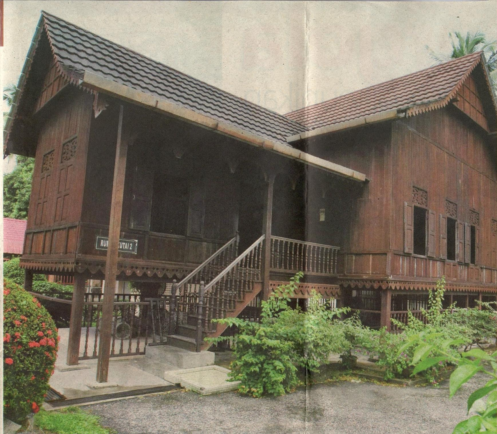
Rumah tradisional berbumbung tebar layar.