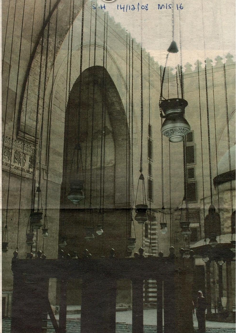
Pameran Ilham Suci memberi peluang kepada pengunjung menghayati keindahan seni bina Islam.