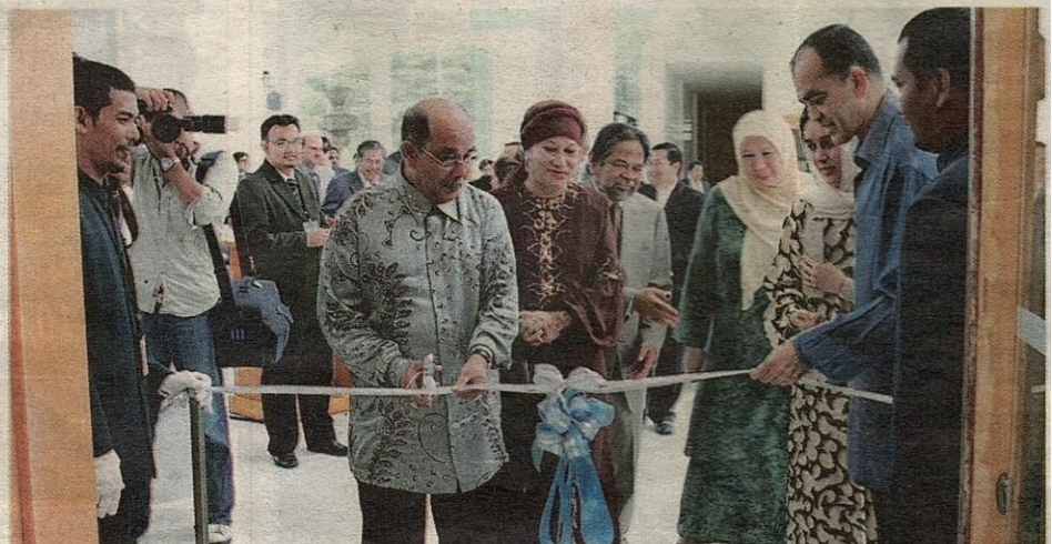
Menteri Dalam Negeri, Datuk Seri Syed Hamid Albar ketika merasmikan pameran berkenaan.