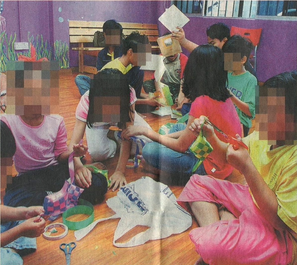
BERKUMPUL: Kanak-kanak akan berasa lebih selamat di bawah penjagaan pihak yang betul.