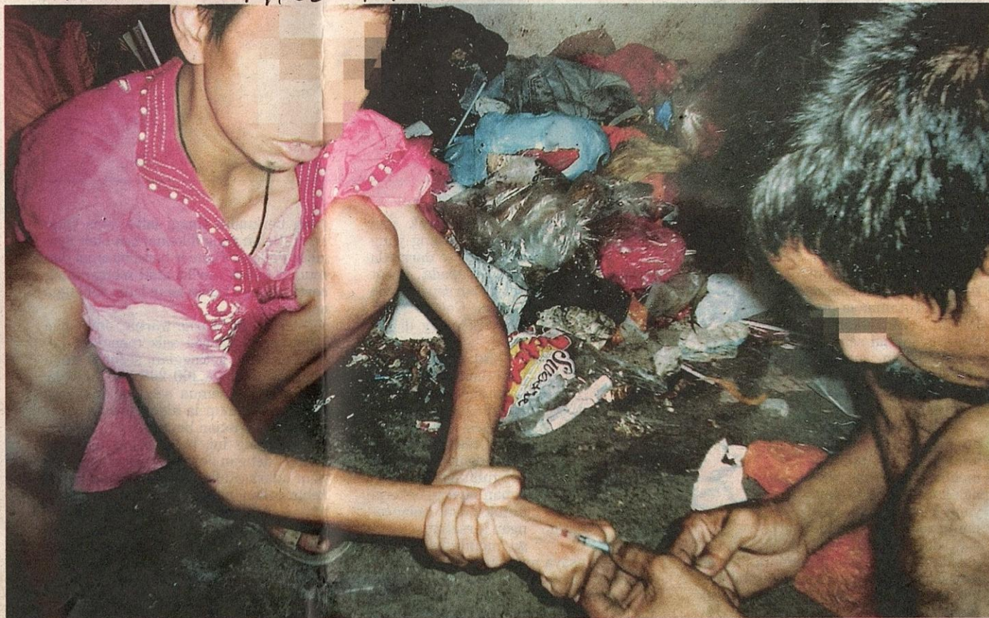
JUMLAH besar penagih tegar yang kembali menagih menimbulkan persoalan, adakah teknik rawatan selama ini masih relevan? – Gambar hiasan

Sivakumar berkata matlamat rawatan bagi penagih ialah untuk memperbaharui