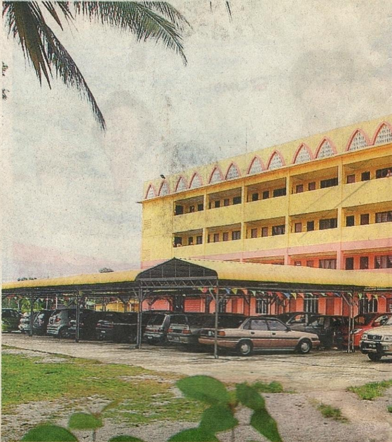
JADI KEBANGGAAN: Bangunan kuliah dan makmal Kist.

"Lihat Ketua Eksekutif Kumpulan AirAsia, Datuk Tony Fernandes. Beliau bukannya berpengalaman atau berkelulusan dalam penerbangan, tetapi berjaya membina sebuah empayar penerbangan terkemuka di