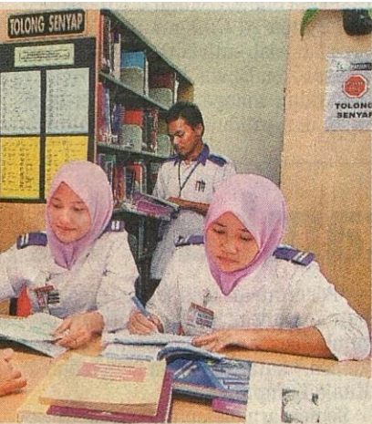
uas serta terkini bagi pelajar mentelaah.