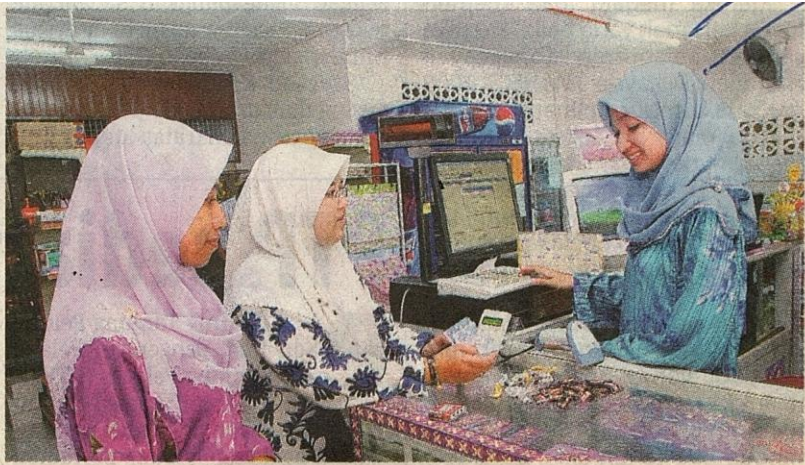
KEMUDAHAN: Kedai serba nika dengan pelbagai keperluan pelajar disediakan.