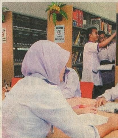
SELESA: Bilik perpustakaan yang cukup l