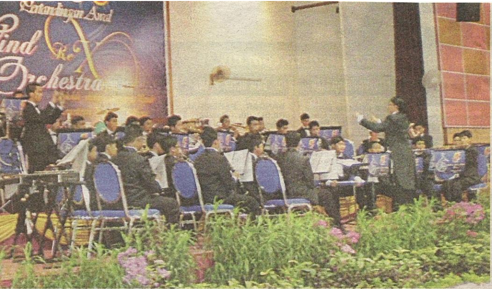
Orkestra SSAS membuat persembahan pada pertandingan Wind Orchestra antarabangsa di Singapura.