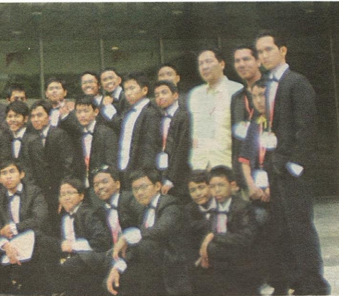
angsa di Singapura, baru-baru ini.