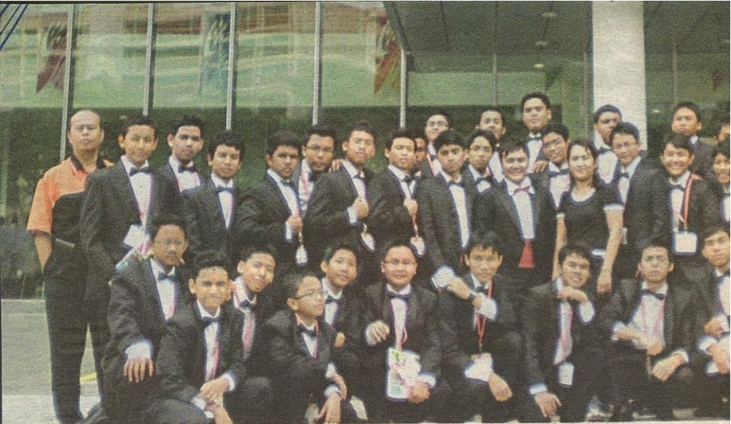
CEMERLANG: Pasukan Orkestra SSAS memenangi Anugerah Perak pertandingan Wind Orchestra antarabang