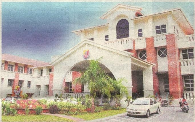
CANGGIH: Bangunan SSAS Putrajaya dengan kos pembinaan RM54 juta antara Sekolah Berasrama Penuh termahal di negara ini.

Tingkatan Satu hingga Lima diadakan secara berterusan dan kemudahan peralatan gimnasium.