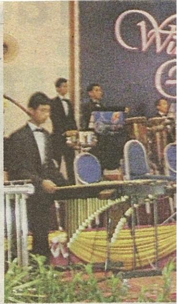
KEBANGGAAN NEGARA: Pasukan Or