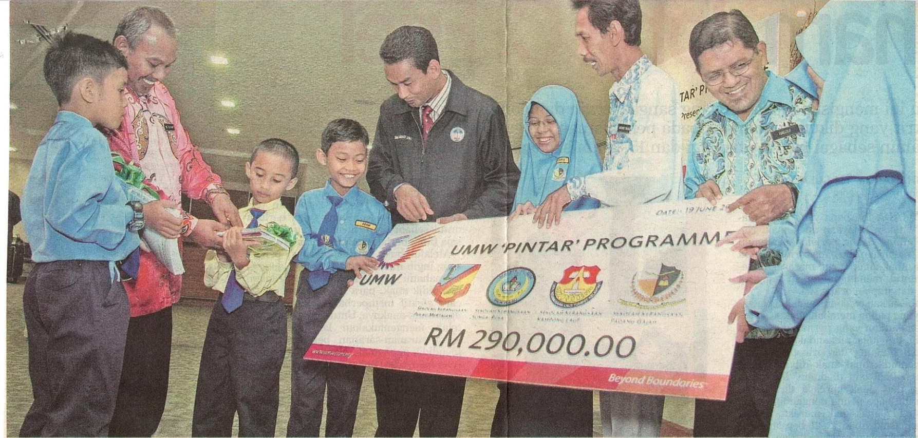
INISIATIF UMW ini diterima baik oleh golongan pelajar dan komuniti pendidikan.