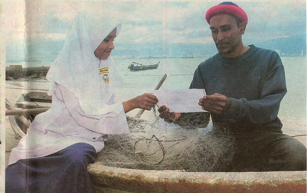
UMW sedar bahawa murid-murid yang datang dari keluarga kurang berkemampuan perlu dibantu. – Gambar hiasan