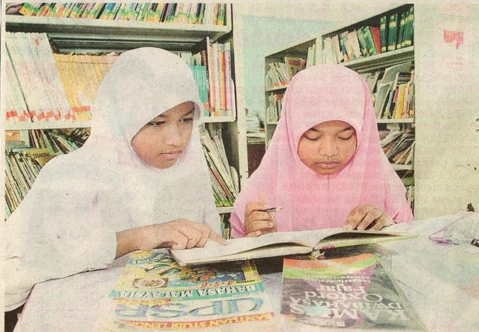
PESERTA Program PINTAR turut diberi kemudahan buku kerja tambahan. – Gambar hiasan

Kami memberi biasiswa dan ganjaran kepada murid yang memperoleh keputusan cemerlang. Kualiti penguasaan bahasa Inggeris mereka juga dipertingkatkan, terutamanya dalam kalangan murid dari kawasan pedalaman – SUSEELA MENON