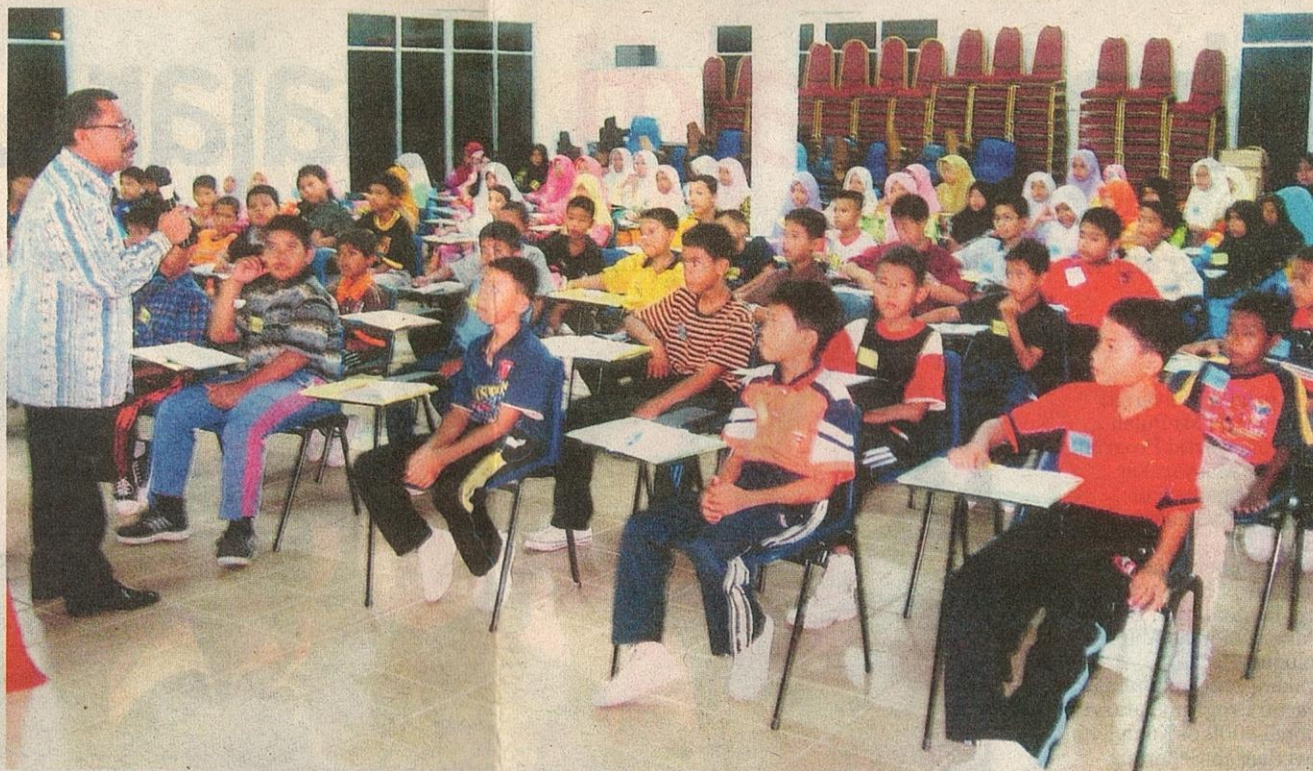
CERAMAH motivasi penting bagi memastikan murid-murid ini terus bersemangat untuk belajar dan memperbaiki kelemahan diri.

Komitmen UMW terhadap pembangunan pendidikan bukan suatu perkara yang baru. Syarikat ini sentiasa prihatin terhadap keperluan untuk membantu pelajar, lebih-lebih lagi kepada mereka yang datang dari keluarga sosio-ekonominya kurang