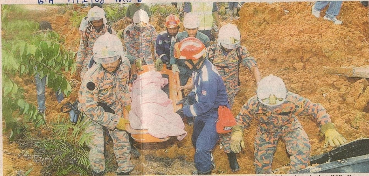
PASUKAN penyelamat mengeluarkan salah seorang mangsa runtuhannya tanah yang menimpa sebuah banglo setingkat di Ulu Yam.

Suasana pilu turut menyelubungi tempat kejadian apa-