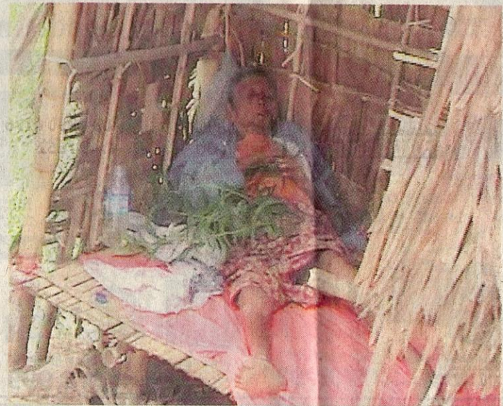
HARAP BANTUAN: Seorang wanita tua menunggu bantuan di perkampungan Kun Char Crone dekat Yangon, kelmarin.