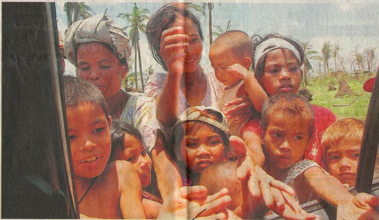
TAGIH SIMPATI: Orang dewasa dan kanak-kanak merayu makanan daripada penumpang kereta yang lalu di Bogalay, barat daya Myanmar, semalam.