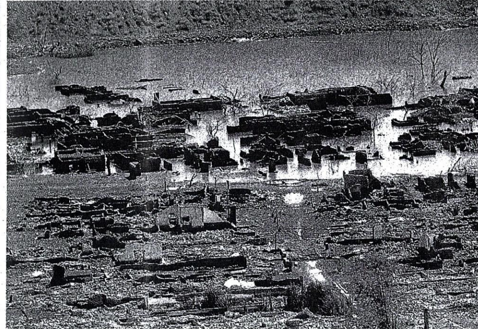
MUSNAH... saki-baki sebuah kampung terdampar dalam lumpur yang terkeluar dari perut bumi berhampiran gunung berapi di Sidoarjo.

Bagaimanapun, setakat ini, tidak siapa tahu jumlah yang sudah diagihkan.