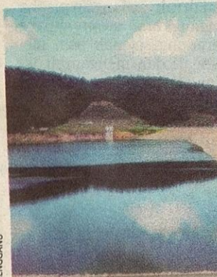
SUMBER KEHIDUPAN: Air di Empangan Air Itam, Pulau Pinang ini bersih dan jernih, sekali gus mencetuskan panorama indah.

Di Malaysia, bagaimanakah padi sebagai makanan ruji negara dapat dihasilkan seki-