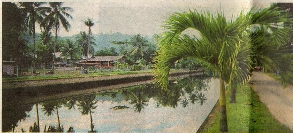
JERNIH: Sungai di Chukai, Kemaman ini sungguh bersih dan indah sehingga pokok kelapa yang ditanam di tebingnya jelas terbayang di air. Tahniyah kepada penduduk tempatan kerana menjaganya dengan baik.

Ayuh! Janganlah kita pejamkan mata lagi, tetapi pandanglah dengan hati agar kita dapat memberikan satu sinar baru kepada generasi akan datang.