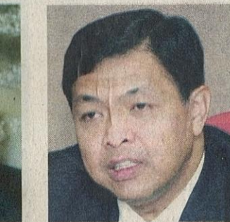
AHMAD ZAHID HAMIDI (JPM)