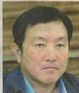
ONG KA CHUAN (PERUMAHAN DAN KERAJAAN TEMPATAN)