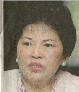
NG YEN YEN (WANITA, KELUARGA DAN MASYARAKAT)