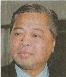
ISMAIL SABRI YAAKOB (BELIA DAN SUKAN)