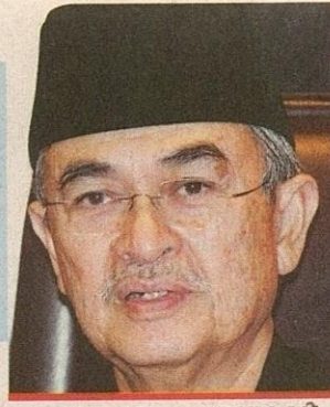
DATUK SERI ABDULLAH AHMAD BADAWI