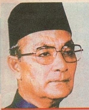
TUN HUSSEIN ONN