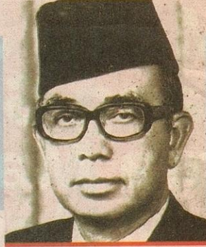
TUN ABDUL RAZAK HUSSEIN