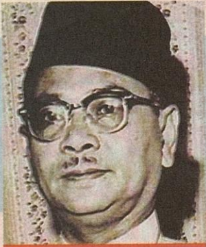
TUNKU ABDUL RAHMAN PUTRA AL HAJ