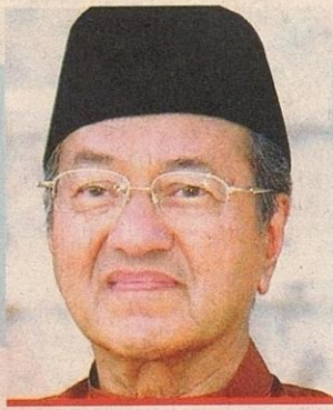
TUN DR. MAHATHIR MOHAMAD