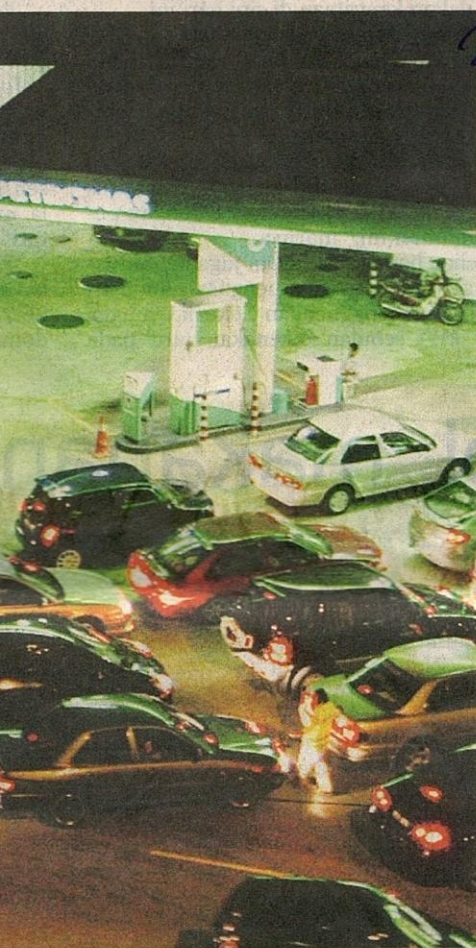
minyak di stesen minyak Petronas Kampung keadaan yang sama berlaku di seluruh negara.