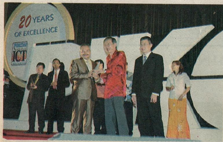
Menteri Besar Selangor, Datuk Seri Mohd Khir Toyo sewaktu menerima anugerah "ICT Development Awards 2006" daripada PIKOM atas kejayaan Kerajaan Negeri Selangor dalam membangunkan bidang ICT di Selangor.

Sehubungan ini juga, kerajaan negeri akan terus berusaha menjadikan Selangor sebagai Hub ICT Global yang signifikan dengan memaksimumkan manfaat ICT kepada semua rakyatnya. Kuasa ICT yang luar biasa ini pastinya boleh memperbaiki keadaan dan ekonomi serta meningkatkan kualiti hidup rakyat.