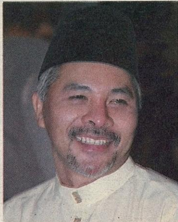
DR MOHAMAD KHIR TOYO