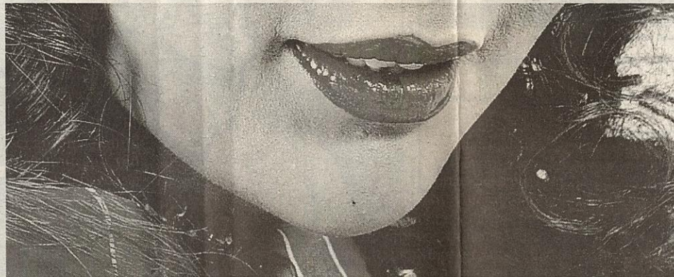
ARTIS 4... sanggup berbelanja RM120,000 untuk pelbagai jenis suntikan di muka, dagu dan tubuh supaya lebih menawan.

mengambil ganja. Kerana itu tubuh saya kurus dan pipi cengkung. Selepas itu, saya nekad mengambil suntikan untuk menjadikan pipi lebih berisi.