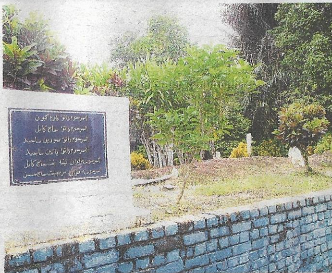
MAKAM Datuk Siamang di Masjid Kampung Terusan Juasseh, Kuala Pilah.

Beliau mendapat gelaran Datuk Siamang Gagap apabila dikatakan bersendirian dalam menentang orang Rawa