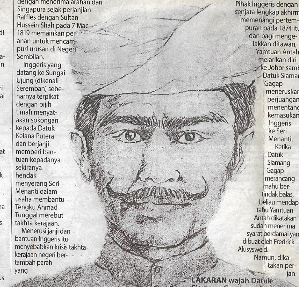
LAKARAN wajah Datuk Siamang Gagap.

Mengikut sumber Datuk Siamang Gagap yang benci dan menentang kuat terhadap Inggeris kemudian mengundurkan diri daripada menjadi pembesar istana dengan melarikan diri ke Pahang selepas penjahaj itu campur tangan sepenuhnya di negeri berkenaan