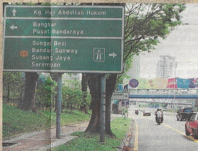
PAPAN tanda ke Kampung Haji Abdullah Hukum di Lembah Pantai