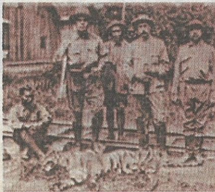
Almarhum Sultan Ibrahim (berdiri kiri) bersama kumpulan pemburu harimau bergambar kenangan di Stesen Parit Samsu pada 1915.