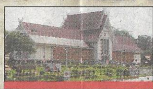
TAPAK Muzium Negara asalnya adalah lokasi Muzium Selangor.

berdasarkan kepada gabungan 13 tiang yang masing-masing kukuh di bahagian timur dan barat bangunan ini bagi menggambarkan Malaysia sebagai sebuah negara yang terbentuk hasil gabungan 13 negeri.