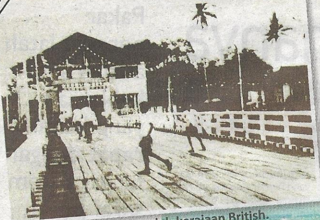
JAMBATAN kayu dibina oleh kerajaan British.