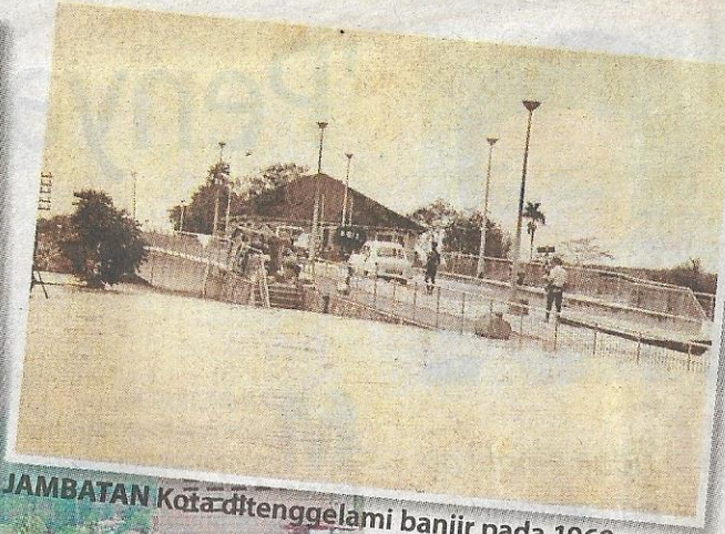
JAMBATAN Kota dtenggelami banjir pada 1969.

Sejak pembinaan jambatan sekitar 1930-an, ekonomi dan pembangunan Kota Tinggi berkembang maju