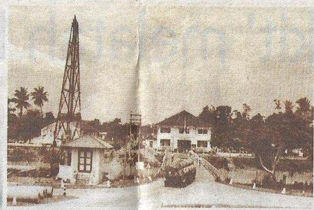
PEMBINAAN jambatan konkrit dimulakan pada 1962.