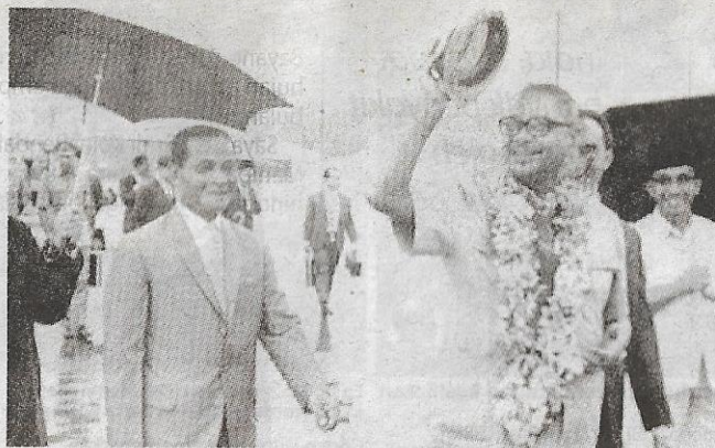
TUN Datu Mustapha (dua dari kiri) bersama Tunku Abdul Rahman di Kota Kinabalu.

nya sebagai seorang budak suruhan kepada Residen British dan berkat kegigihannya serta keazaman yang teguh, Allahyarham meningkat menjadi seorang tokoh besar Malaysia.