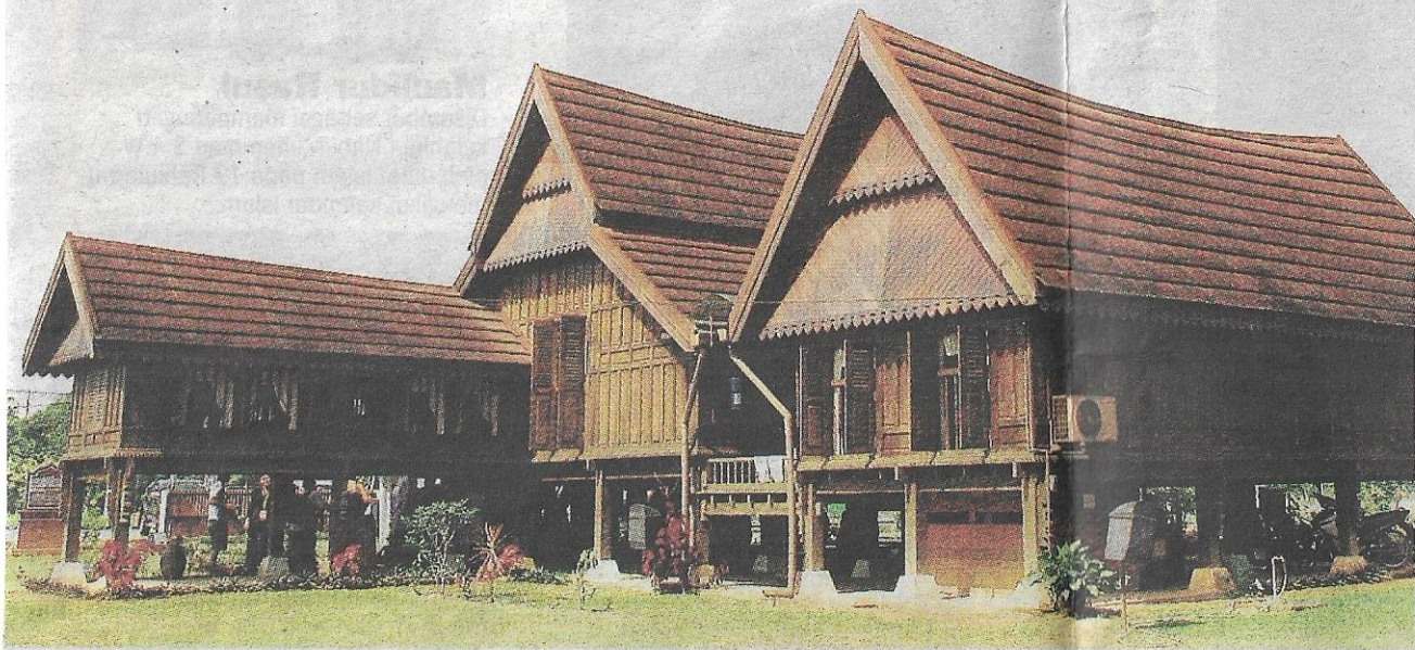
CANTIK... Rumah Limas Negeri Sembilan yang menjadi replika Teratak Za'aba banyak menyimpan sejarah kehidupan tokoh bahasa dan kesusasteraan Melayu itu.