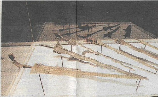
SIMBOL STATUS... pelbagai bentuk keris lama.

Pameran yang julung kali diadakan ini juga bakal menyaksikan keris lama dipercayai milik Sultan Selangor, Sultan Sulaiman Shah, dalam era pemerintahannya sekitar 1880-an, Keris Cik Siti Wan Kembang (1610-1677) dan Keris Sultan