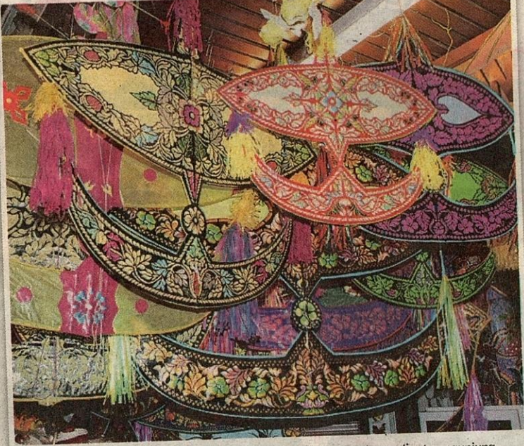
● Kedai Wau Tradisi menawarkan pelbagai saiz dan corak wau buat pengunjung.