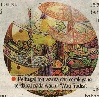
● Pelbagai ton warna dan corak yang terdapat pada wau di ‘Wau Tradisi’.

Busul akan diregangkan di bahagian belakang tengkuw wau, agar ianya mengeluarkan bunyi dengung apabila