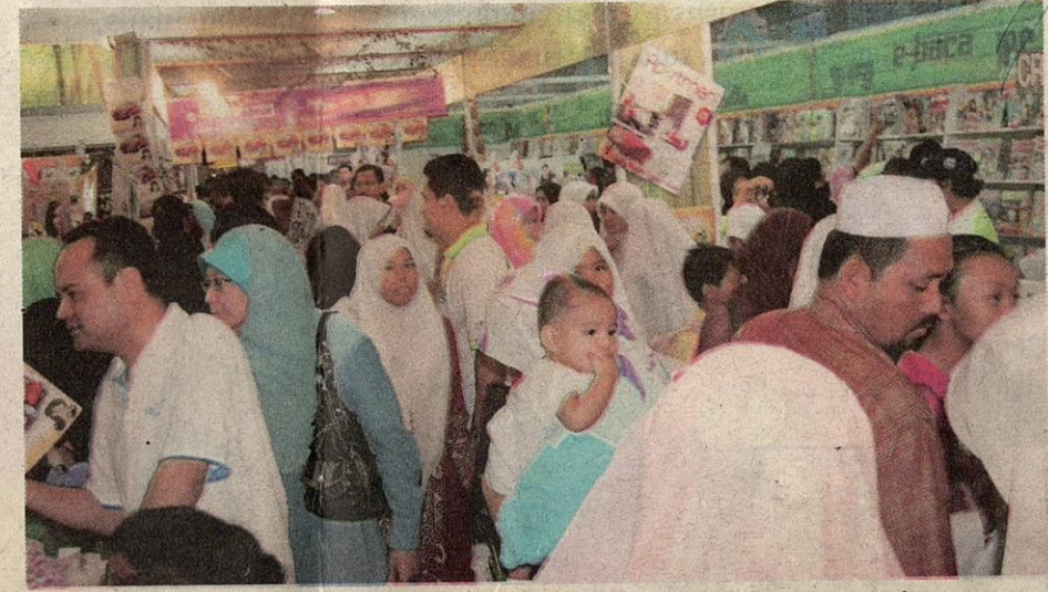
● Kesyakan di gerai bukan halangan pengunjung mencari majalah kegemaran di gerai Karang kraf.