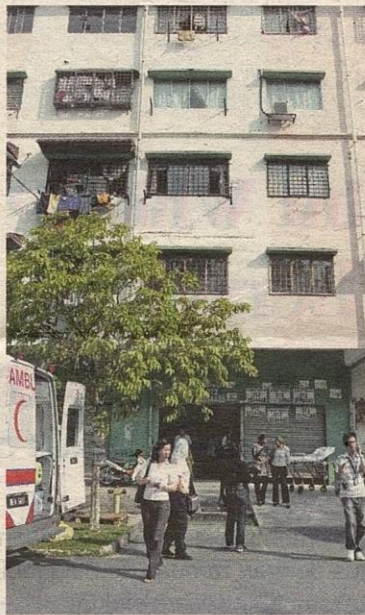
DUA lelaki yang dikurung ah long dalam sebuah bilik kurungan di Serdang Raya semalam.

“Kita semasa itu tidak ada petunjuk mengenai kehilangan suami wanita itu dengan sindiket ah long yang telah mengurung mangsa,” katanya.