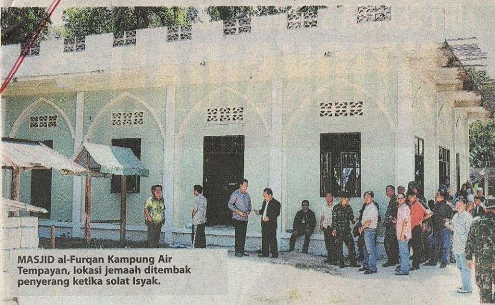
MASJID al-Furqan Kampung Air Tempayan, lokasi jemaah ditembak penyerang ketika solat Isyak.