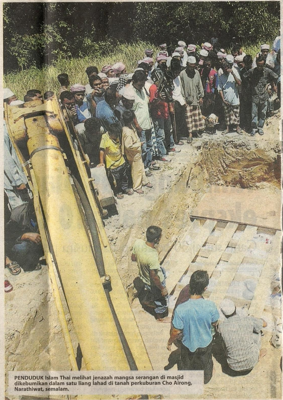
PENDUDUK Islam Thai melihat jenazah mangsa serangan di masjid dikebumikan dalam satu liang lahad di tanah perkuburan Cho Airong, Narathiwat, semalam.

Keganasan dilaporkan meningkat di selatan Thailand sejak beberapa minggu lalu. Sejak Januari 2004 hingga kini, lebih 3,500 orang terbunuh dalam pelbagai siri keganasan di tiga wilayah yang mempunyai majoriti penduduk Islam iaitu Yala, Narathiwat dan Pattani, walaupun lebih