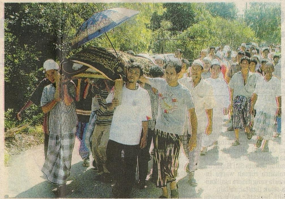
PENDUDUK membawa jenazah mangsa terkorban dalam serangan ke tanah perkuburan : Cho Airong, Narathiwat, semalam.