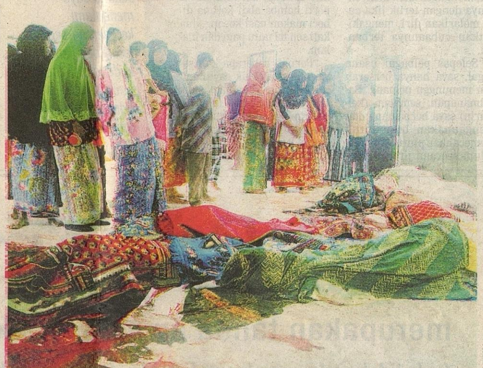
ORANG ramai melihat mayat mangsa serangan di Masjid al-Furqan, Kampung Air Tempayan, malam kelmarin.