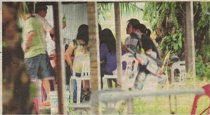
PELANGGAN dan wanita minum arak di kafe ladang.