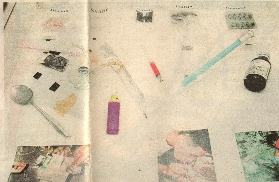
Pelbagai peralatan digunakan untuk menghisap dadah.

"Penagih seperti ini tidak boleh mengawal kemarahan mereka atau panas baran. Perkara biasa kepada orang lain dilihat besar oleh penagih dadah sintetik dan mendorong mereka bertindak ganas," katanya.