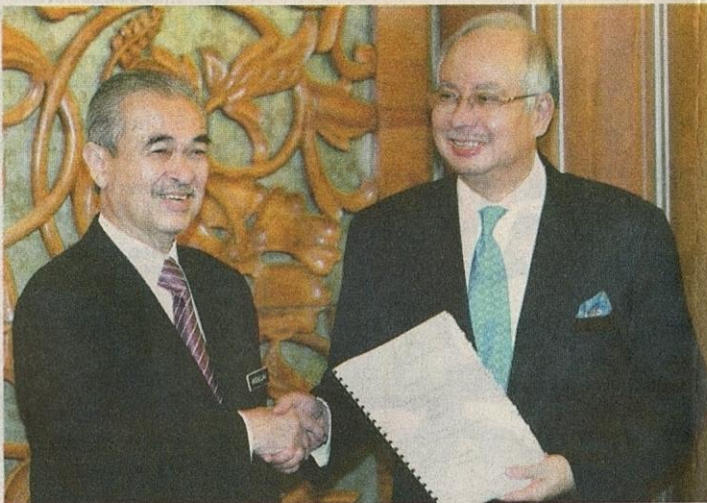
PERDANA Menteri, Datuk Seri Abdullah Ahmad Badawi bersalaman dengan timbalannya, Mohd. Najib selepas pembentangan Bajet Mini di Dewan Rakyat, Kuala Lumpur semalam.

yang dianggap sebagai bajet mini, semasa membentangkan Rang Undang-undang Perbekalan Tambahan 2009 bagi bacaan kali kedua di Dewan Rakyat.