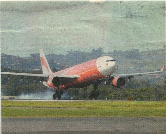
KEADAAN ekonomi kurang cergas menyebabkan pengguna beralih menggunakan penerbangan tambang murah.

“ Kami percaya kesan sebenar hanya akan dirasai bulan ini apabila pengeksport tempatan mula merasakan pengurangan permintaan daripada pasaran antarabangsa”