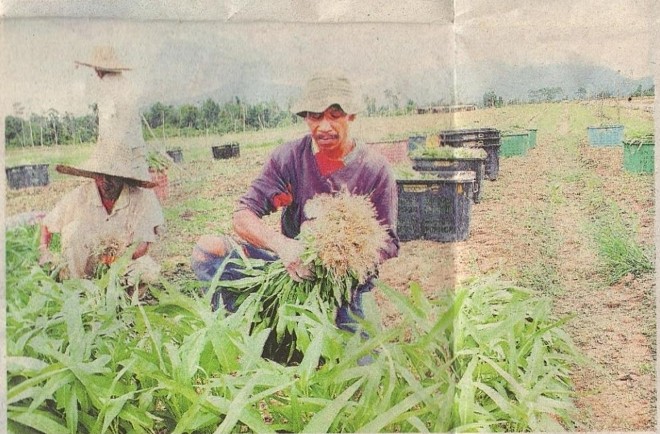
PERUNTUKAN besar dalam sektor pertanian mampu membina asas kekuatan ekonomi negara.

Selain itu, kerajaan akan menyediakan subsidi, insentif dan bantuan berjumlah hampir RM2 bilion kepada petani dan nelayan, termasuk subsidi harga padi lebih RM100 juta dan subsidi lain.