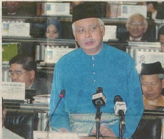
NAJIB ketika membentangkan Bajet 2010 di Parlimen semalam.

Beliau yang segar memakai baju Melayu biru mengambil masa kira-kira dua jam untuk membentangkan ucapan setebal 55 halaman itu.