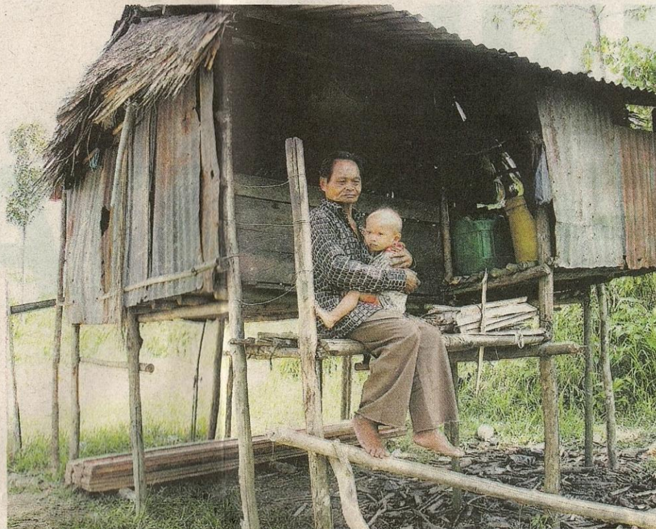
KELUARGA miskin seperti di Pitas, Sabah bakal mendapat faedah daripada program basmi kemiskinan tegar pada Bajet 2010 yang dibentangkan Perdana Menteri, semalam.