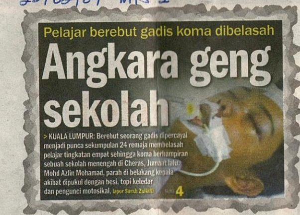
IMBAS KEMBALI... keratan muka depan akhbar Harian Metro 19 Februari lalu.