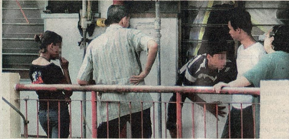
● Tindakan seorang remaja yang memasuki salah sebuah rumah di Blok 19, Pangsapuri Seksyen 16, disangka pencuri oleh penduduk tempatan berikutan kejadian jenayah kerap berlaku di kawasan itu.