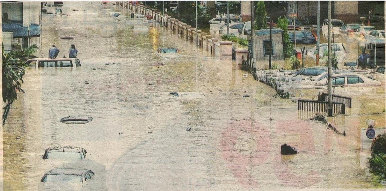
BERPULUH-PULUH kenderaan tenggelam akibat banjir kilat di Jalan Ipoh, semalam.