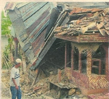
Seorang penduduk melihat keadaan rumah yang runtuh dilanda gempa di Sukabumi.