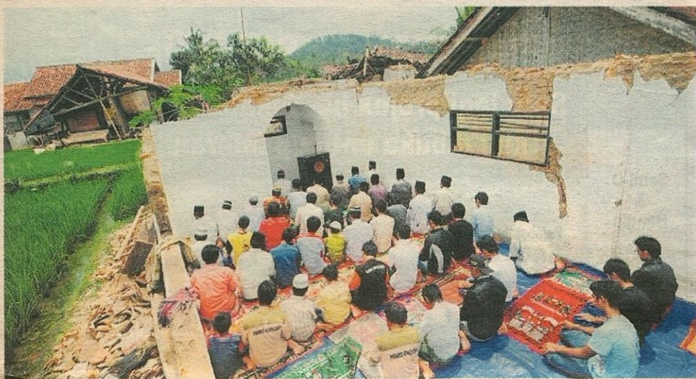
PENDUDUK menunaikan solat Jumaat di masjid Jami al-Muhtar di perkampungan Ciloa, Tasikmalaya.