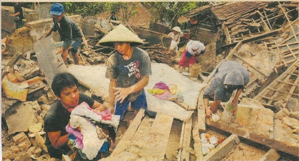
PENDUDUK kampung Ciloa mengumpul apa jua harta yang dapat diselamatkan selepas gempa melanda.