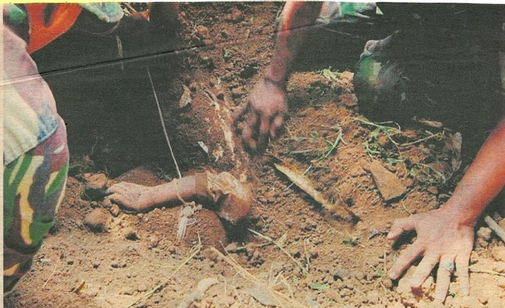
ANGGOTA keselamatan menemui mayat mangsa gempa di Cikangkareng, daerah Cibinong, Khamis lalu.