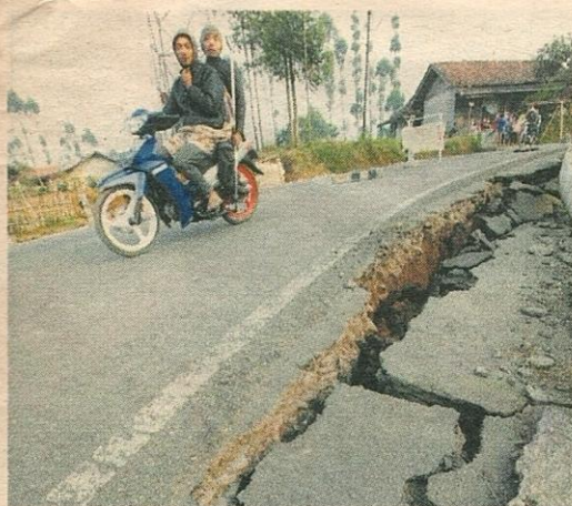
GEMPA turut merosakkan jalan.