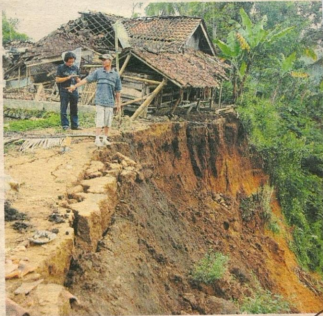
PENDUDUK meninjau kesan gegaran gempa di Jawa Barat.

“Saya takut kerana masih teringat gempa di Yogya tiga tahun lalu,” katanya. Pembeli berkumpul di jalan raya dan keadaan lalu lintas dan talian telefon sesak kerana ramai yang ingin menghubungi anggota keluarga dan kawan. - Agensi